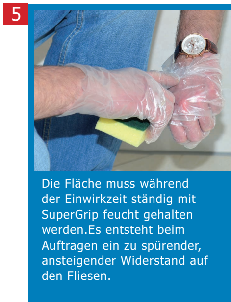
5 Die Fläche muss während der Einwirkzeit ständig mit SuperGrip feucht gehalten werden. Es entsteht beim Auftragen ein zu spürender, ansteigender Widerstand auf den Fliesen.