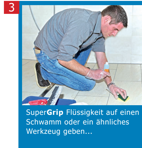
3 SuperGrip Flüssigkeit auf einen Schwamm oder ein ähnliches Werkzeug geben...