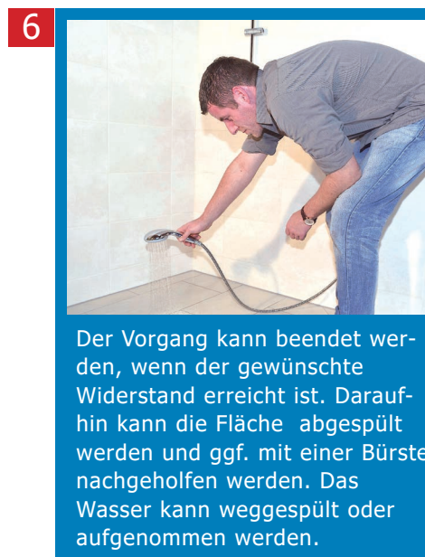
6 Der Vorgang kann beendet werden, wenn der gewünschte Widerstand erreicht ist. Daraufhin kann die Fläche abgespült werden und ggf. mit einer Bürste nachgeholfen werden. Das Wasser kann weggespült oder aufgenommen werden.