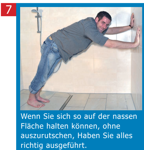
7 Wenn Sie sich so auf der nassen Fläche halten können, ohne auszurutschen, Haben Sie alles richtig ausgeführt.