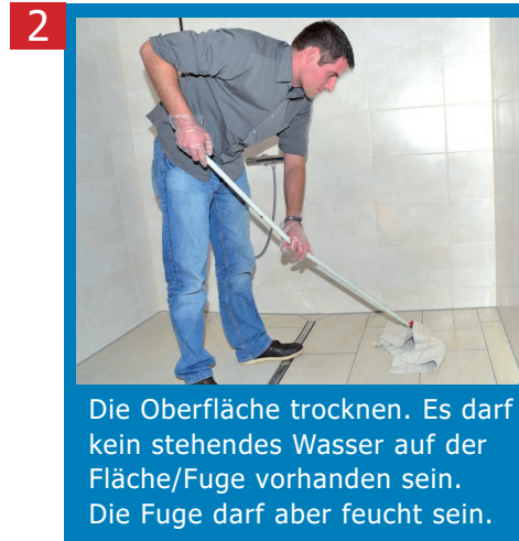
2 Die Oberfläche trocknen. Es darf kein stehendes Wasser auf der Fläche/Fuge vorhanden sein. Die Fuge darf aber feucht sein.