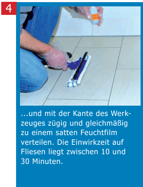
4 ...und mit der Kante des Werkzeuges zügig und gleichmäßig zu einem satten Feuchtfilm verteilen. Die Einwirkzeit auf Fliesen liegt zwischen 10 und 30 Minuten.